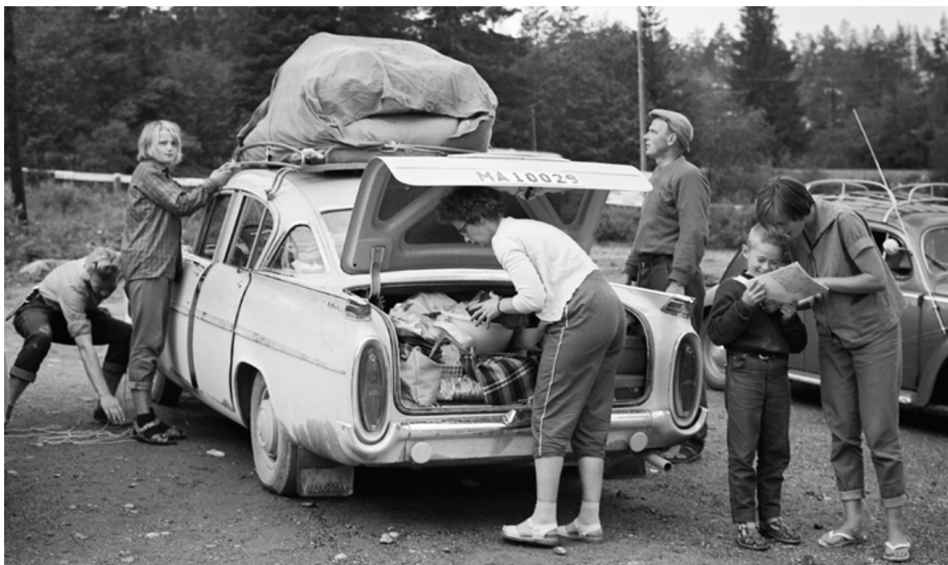
Bilsemester ca 1960.