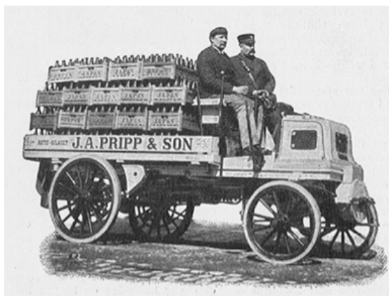
Första lastbilsturen i Sverige.