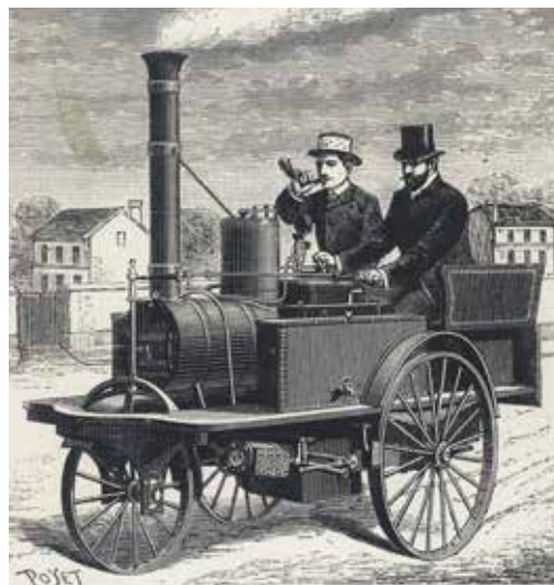
Ångbil Frankrike 1886.

En av världens första fordon som liknade en bil och som kunde transportera människor drevs av ånga och det var i slutet av 1700-talet. Det var en vagn som rymde fyra personer och som gick i 4 km/h. Det är ungefär samma hastighet som när du går snabbt. Den första bil som tillverkades i Sverige var också en ångbil och det var år 1892. Men ångbilarna övergavs efterhand, de gick för långsamt och behövde fyllas på med vatten väldigt ofta.