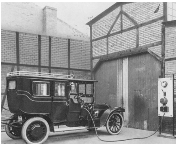
Elbil laddas ca år 1900.

Idag blir det alltmer vanligt med elbilar som drivs av en eller flera elmotorer som får ström av batterier. Men elbilen är inte ny, den uppfanns redan i mitten av 1800-talet. En av de första som köpte en elbil var sultanen Abdül-Hamid i Turkiet. Han fick höra talas om en självgående vagn i England och blev så intresserad att han genast beställde en. Elbilar blev i början populära som stadsbilar och var under en period vid sekelskiftet 1900 den vanligaste bilen. Men efter ett tag tröttnade många på elbilen eftersom batterierna behövde laddas väldigt ofta. Idag har elbilen blivit allt vanligare igen. Det beror på att batteritekniken har utvecklats så att bilarna kan köra längre sträckor innan de behöver laddas.