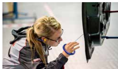
Några exempel på yrken där du arbetar med fordon; racingmekaniker, fordonsmekaniker och fordonslackare.