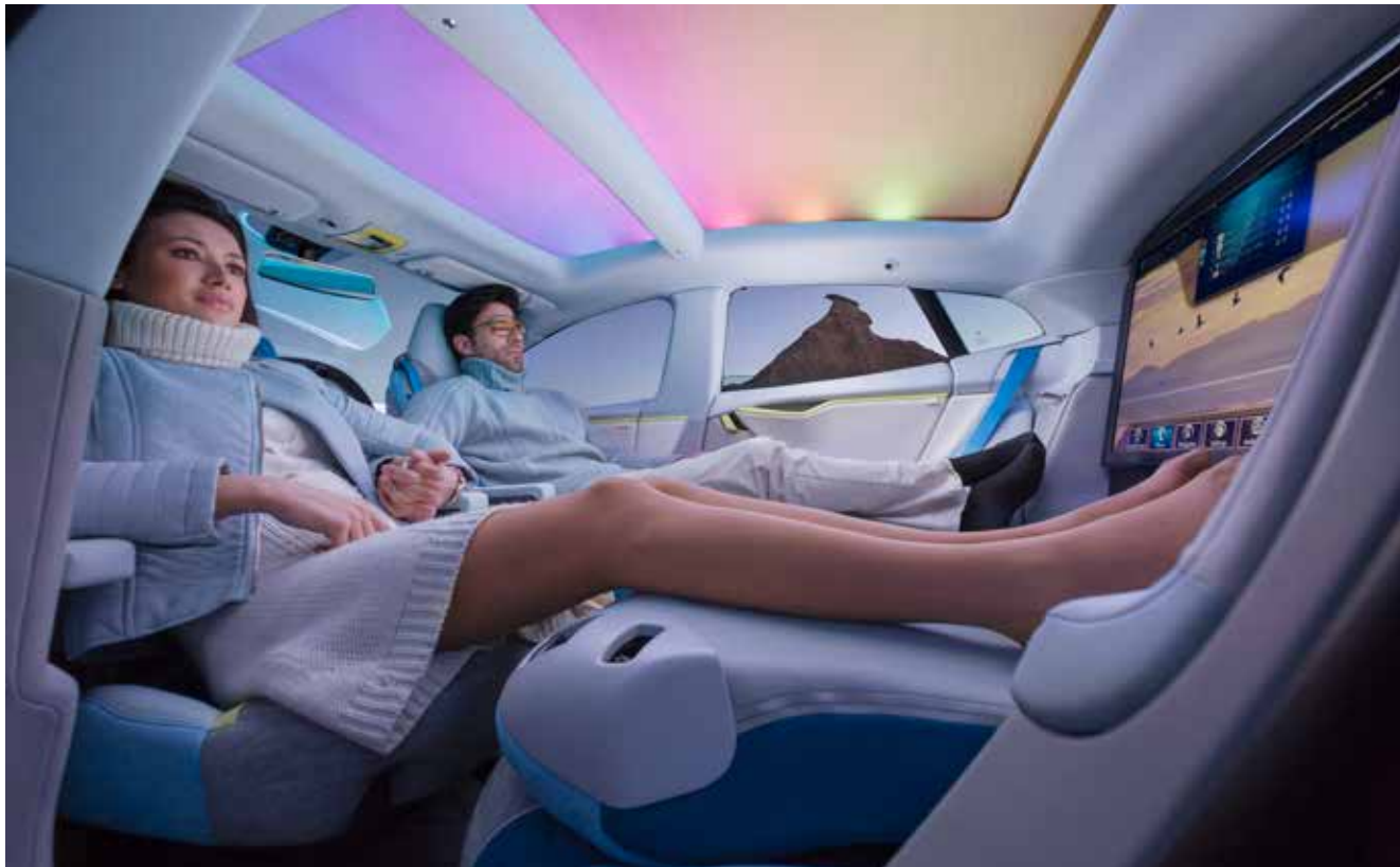
Med ögon på tv-skärmen istället för på vägen i den förarlösa bilen.

Idag finns det bilar med så kallade farthållare som ser till att bilen kör i rätt hastighet. Det finns bilar som parkerar sig själva. Bilar som automatiskt håller sig på vägen och inte hamnar i diket eller riskerar att krocka med andra bilar. Nu har även bilar som helt kör sig själva utvecklats. Föraren behöver inte hålla händerna på ratten utan bestämmer resmålet och sen gör fordonet resten. Under tiden kanske föraren tittar på film, läser eller sover en stund. Vad tror du, är det så här vi kommer att färdas i framtiden?