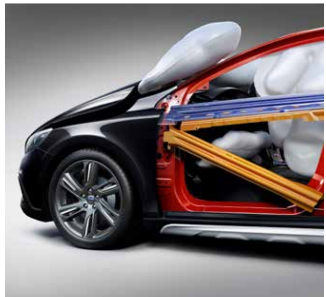
Genomskäring av en Volvo V40.

I början av 1900-talet kan man säga att bilen var färdig. Det var den bensindrivna bilen med en så kallad förbränningsmotor som blev den teknik som slog igenom på allvar. Medan ångmaskinen omvandlar vattenånga till rörelseenergi, så skapar förbränningsmotorn rörelseenergi genom antändning av en blandning av luft och bensin eller dieselolja. Med den kunde bilarna gå betydligt snabbare och köra längre sträckor. Efterhand har bilarna utvecklats på många sätt. Motorn har placerats fram, styrspaken har ersatts med en ratt och bilarna har fått luftpumpade hjul. Det här har gjort att det blivit bekvämare för både förare och passagerare. Även motorerna har blivit bättre och mer energisnåla. Bilarna har också blivit säkrare med till exempel säkerhetsbälten, krockkuddar och bättre karosser.