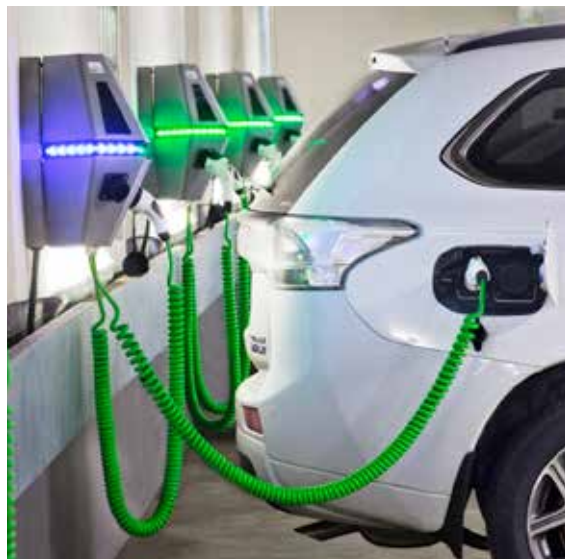
Elbil vid laddstation ca år 2017.