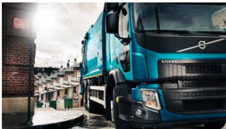
Modern lastbil från Volvo.