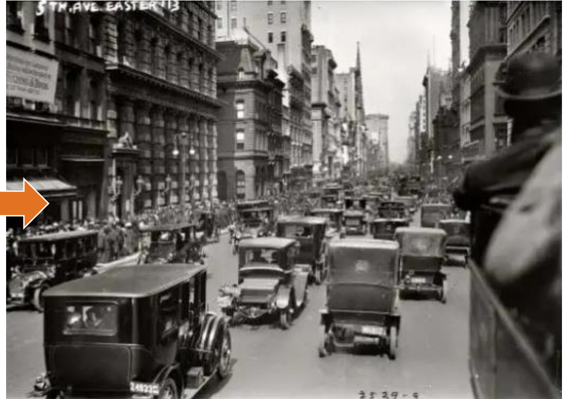
New York 1913