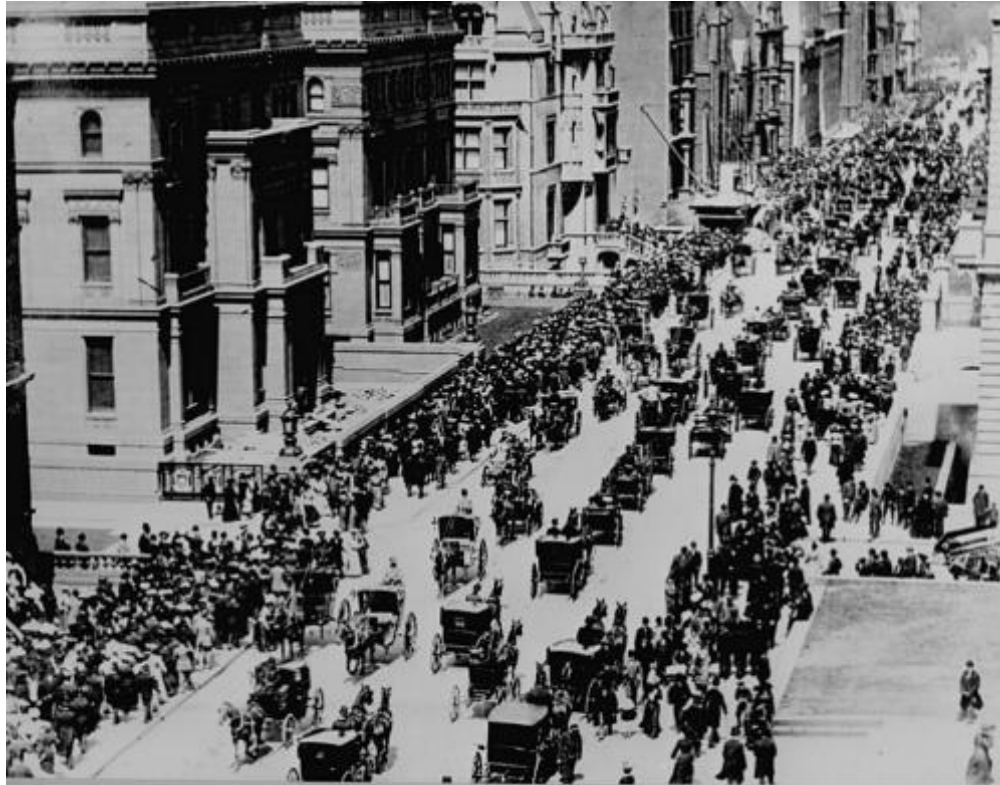
New York 1903